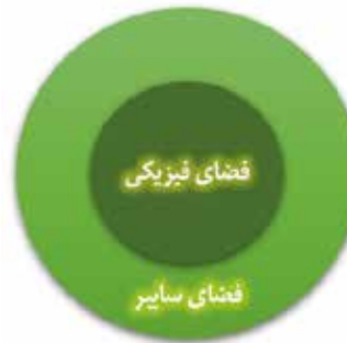
نسبت فضای فیزیکی و فضای سایبر در فلسفه‌ی امتدادی

از سوی دیگر در مقابل رویکرد دو فضایی، «رویکرد امتدادی» وجود دارد و بدین معنا است که فضای سایبر، برآمده و در ادامه‌ی فضای فیزیکی است. از این رو است که به آن رویکرد امتدادی گفته می‌شود زیرا در ادامه‌ی فضای فیزیکی تعریف شده، نه در موازات آن. در رویکرد امتدادی، خبری از فضای مجازی نیست بلکه خود سایبر مطرح است، به آن سایبر گفته می‌شود و فضای سایبر امتداد یا گسترده شده‌ی فضای فیزیکی تلقی می‌گردد.